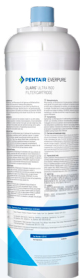
Kop apart verkocht.

CLARIS ULTRA 1500 FILTERPATROON: 4339-83