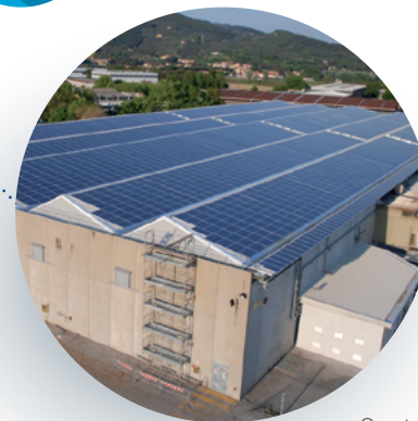
Centro de producción Fleck en Pisa, Italia