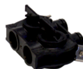
Bypass in plastic