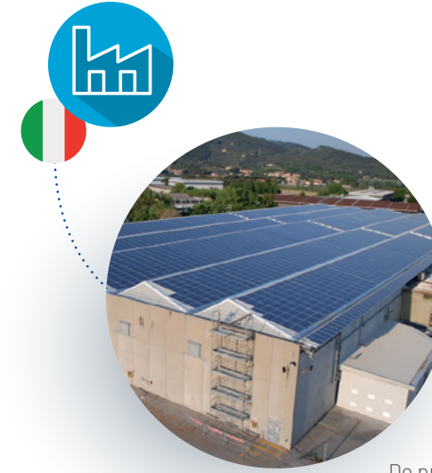
De productievestiging van Fleck in Pisa, Italië

Vanaf de jaren 1970 worden de kleppen van Fleck (behalve de meest recente 5810- en 5812-kleppen) in Europa geassembleerd om de Europese klanten een betere dienstverlening te bieden. Vandaag is de productie in ons Europees kenniscentrum voor kleppen in Pisa (Italië) ondergebracht, waar eerder al de Autotrol- en Siata-kleppen geassembleerd werden.